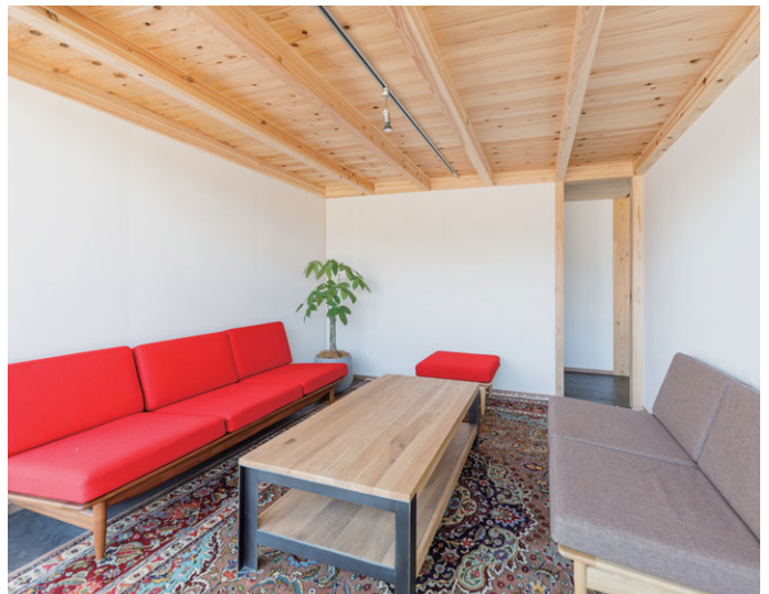
“みかんの丘”に建設中のシンケン新事務所の一室。どの空間も壁はすべてMOISS

じつは今、シンケンでは現本社(鹿児島市下荒田)とは別に、市北部の丘の上に新事務所を建設中です。広大な杉山を切り拓いたその地を“みかん(未完)の丘”と名づけています。“未完”とは「これからも変化し成長できる」こと。むしろ“未完”にこそ意義がある、との想いが込められています。そんな丘に建設中の新事務所にも、MOISSが壁と天井に組まれています。従来のオフィスの常識を超えた、素晴らしい空間が生まれ、その“成長”をMOISSが支えています。